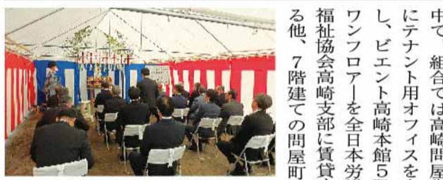
組合役員も出席し地鎮祭を実施