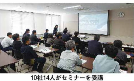
10社14人がセミナーを受講

卸売業界にとって、物流の配車や配送業務の合理化・効率化への取り組みは喫緊の課題である。そのため組合では、「卸売業のための配車・配送業務の最適化運用セミナー」と題して、3月23日(月)午後2時より、ビエント高崎本館会議室において、組合員並びに賛助会員を対象に、物流の課題解決の一助となるべくセミナーを開催した。