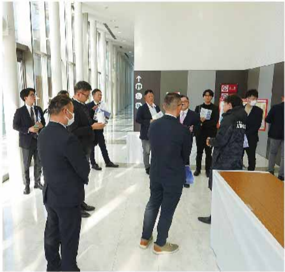
視察来所した会津若松卸商団地(協)

盛況である。今年も1000人程の参加を見越しての実施を予定している。福祉活動の中で最も歴史があるハイキングは気候の良い10月頃を大型バス2台で予定している。