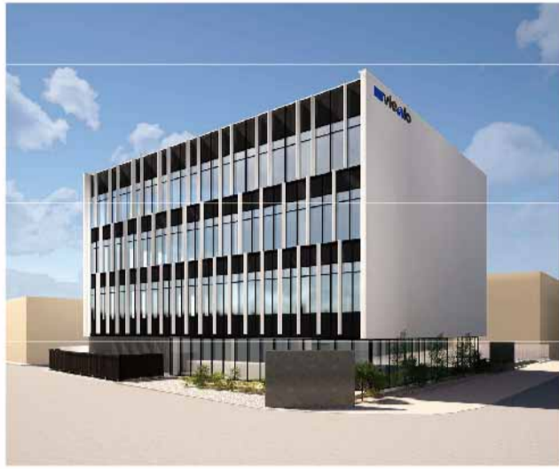
新しいオフィステナントビルの外観パース図

組合では、高崎問屋街内の敷地を利用し、組合が所有管理する新たなテナントオフィスビルの建設に取り掛かった。同ビルは4階建てで、主にオフィスビルとしてテナント入居を募集している。また、1階は飲食店用の空間を設け、現在、入居店舗を募集している。完成は本年11月中旬を予定している。